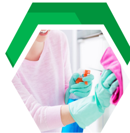
Cuidado del Hogar