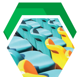
Aditivos para Polímeros